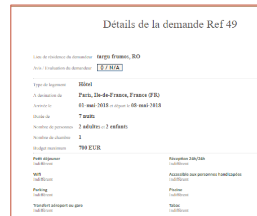
Exemple de demande d'hébergement

Autre avantage de notre plateforme, la possibilité de converser directement avec le futur client et ainsi préparer au mieux la prestation. Tous ces échanges sont consignés dans le devis pour éviter toute contestation future.