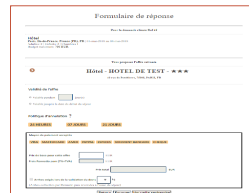
Exemple de formulaire de réponse à une demande d'hébergement